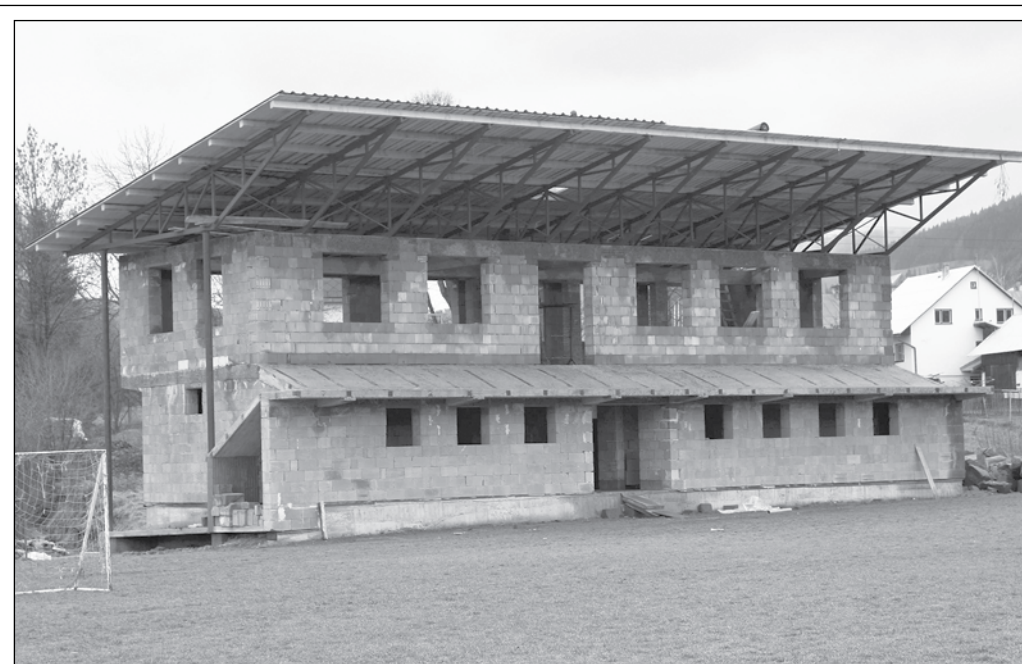
Rozostavaná tribúna na futbalovom ihrisku

Obec ďakuje za doterajšiu pomoc pri výstavbe športovcom, podnikateľom a občanom