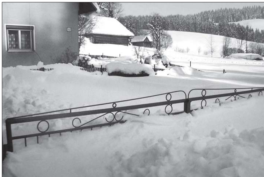
2005 Dlhá zima s ohromným množstvom snehu – prírodná scenéria