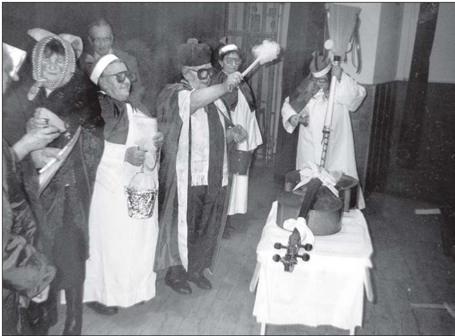
7. 2. 2005 Pochovanie basy