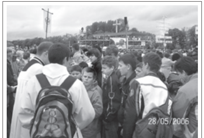
Naši minštranti na stretnutí so Svätým Otcom Benediktom XVI. v Krakowe