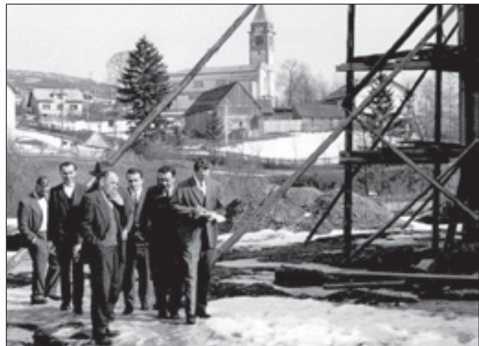
Kontrolný deň na stavbe KD